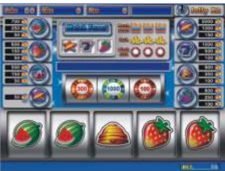
mod. DOUBLE 19" Peso Kg 85