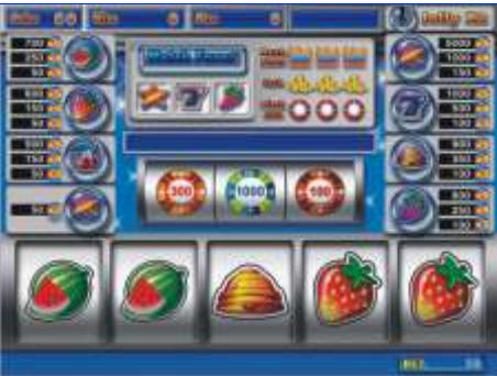
mod. DOUBLE 19" Peso Kg 85